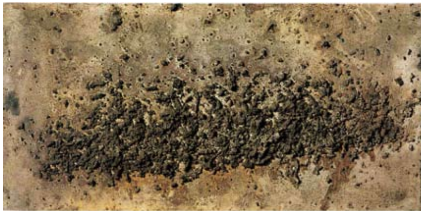
Terra i pintura , 1956 (Tècnica: procediment mix sobre fusta).