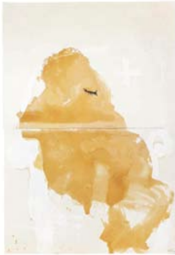
Figura amb parpella, 1989