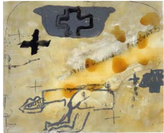
Pintors malvats, 1988