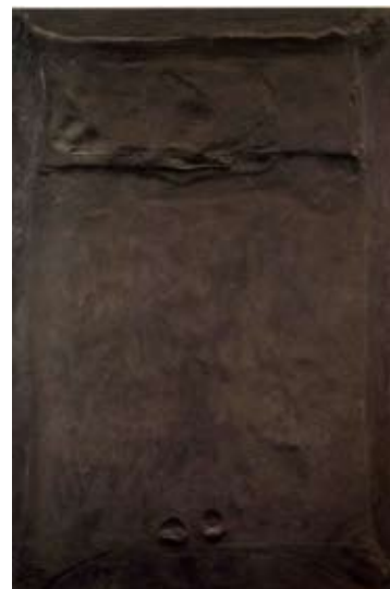
Llit marró, 1960