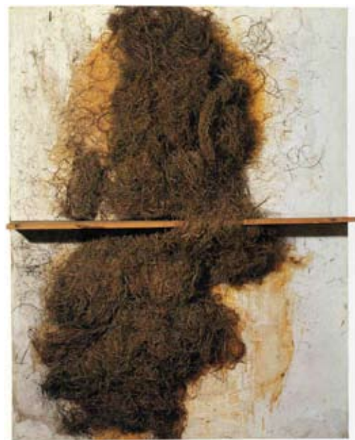
Palla i fusta , 1969 (Tècnica: assemblatge sobre tela).