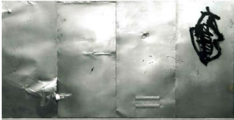
Metall i ampolla , 1993 (Tècnica: pintura i assemblatge sobre planxa metàl·lica muntada).