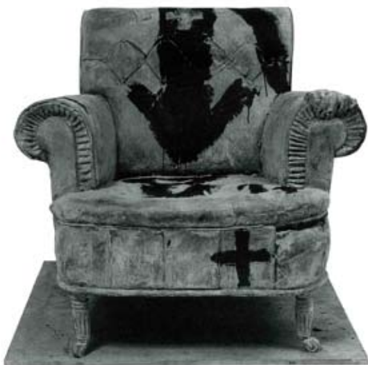
La butaca, 1987