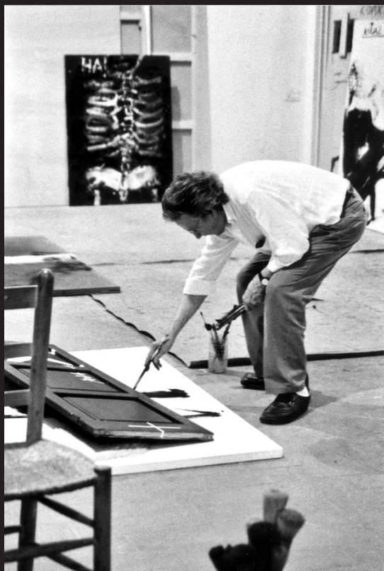
Antoni Tàpies a l'estudi de Campins, 2003. Darrere seu es poden apreciar dos trossos de tèxtil sintètic per protegir el terra.

La Fundació recupera l'exposició Certeses sentides , ampliada amb peces que no s'havien inclòs a l'edició anterior, i acompanyada d'una sèrie d'escultures de bronze i de terra xamotada del mateix període.