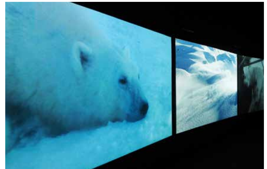
Vertigo Sea (2015)