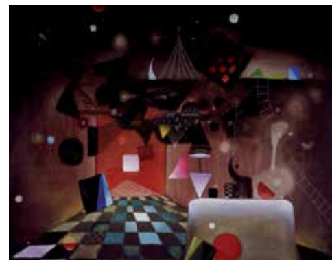
Antoni Tàpies Parafaragamus, 1949 Oli sobre tela 89 × 116 cm