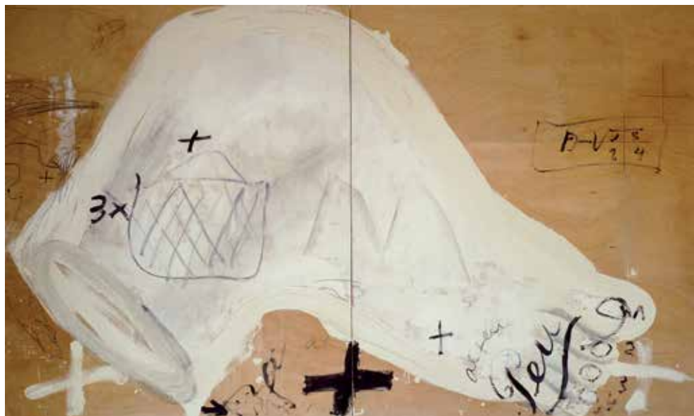
Antoni Tàpies Al teu peu, 1989 Pintura i llapis sobre fusta 300 × 500 cm