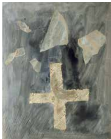
Antoni Tàpies Creu de paper de diari, 1946-1947 Collage i aquarel·la sobre paper 40 × 31 cm