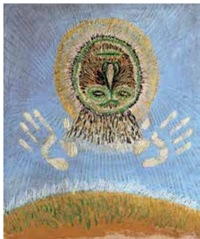
Antoni Tàpies Zoom, 1946 Oli i blanc d'Espanya sobre tela 65 × 54 cm